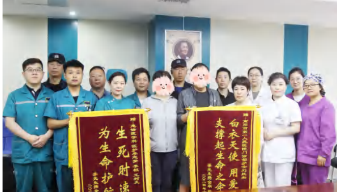
患者康复出院赠送锦旗表示感谢