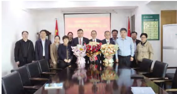
我院领导欢送援赞比亚中国医疗队队员出征

4月25日,河南省承派援外医疗队50周年纪念会议暨援外医疗队出征仪式在郑州举行。省委书记楼阳生作出批示,省委副书记孙梅君会见医疗队队员代表,并向曾经、正在和即将出发执行援外医疗任务的同志们致以诚挚的慰问。会议由省卫健委党组副书记、副主任侯红主持。