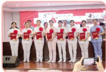
护龄三十年以上护士颁证