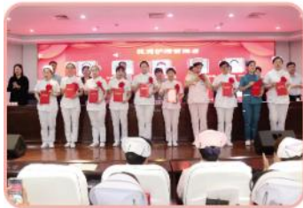
优秀护理管理者代表